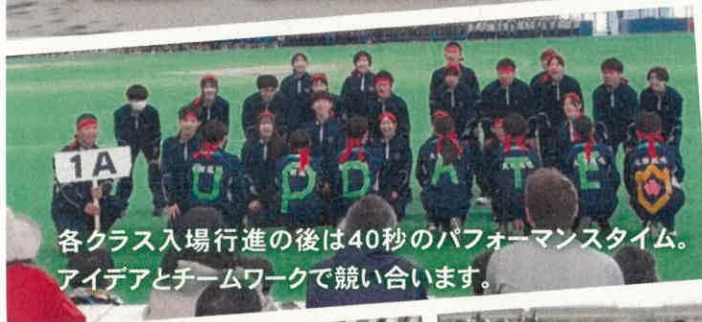
各クラス入場行進の後には40秒のパフォーマンスタイム。アイデアとチームワークで競い合います。