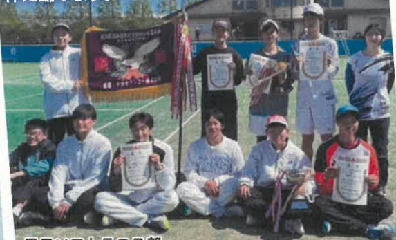
男子ソフトテニス部 団体 優勝