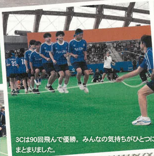
3Cは90回飛んで優勝。みんなの気持ちがひとつにまとまりました。