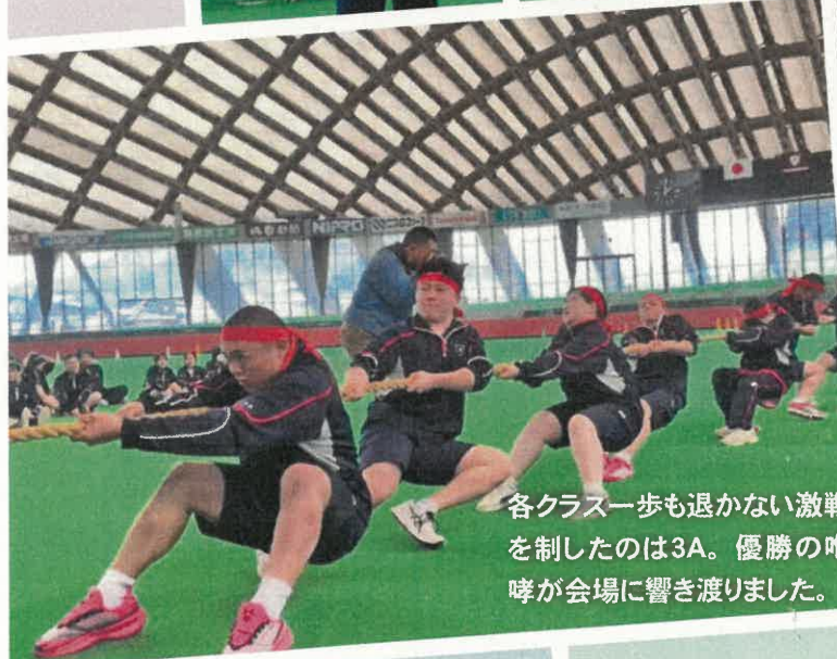
各クラス一歩も退かない激戦を制したのは3A。優勝の咆哮が会場に響き渡りました。