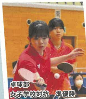
卓球部 女子学校対抗 準優勝