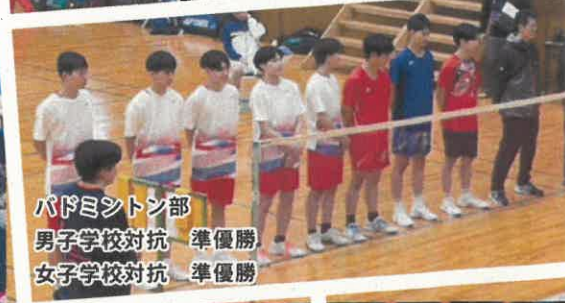
バドミントン部 男子学校対抗 準優勝 女子学校対抗 準優勝