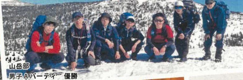
山岳部 男子Aパーティー 優勝