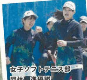
女子ソフトテニス部 団体 準優勝