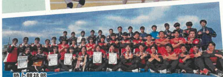
陸上競技部 女子総合 優勝 男子総合 準優勝