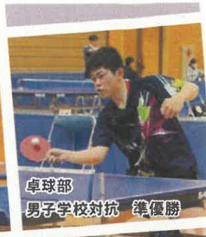
卓球部 男子学校対抗 準優勝