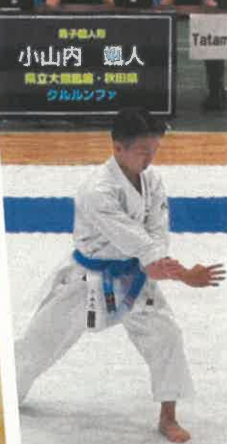
空手道 男子個人形 優勝