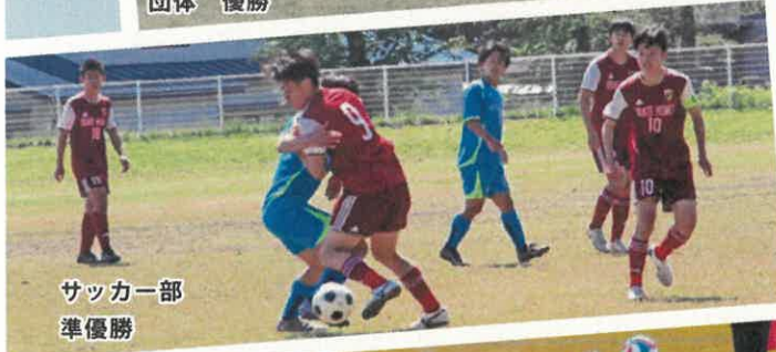
サッカー部 準優勝