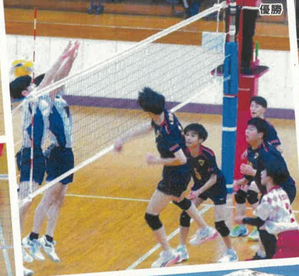
男子バレーボール部 優勝